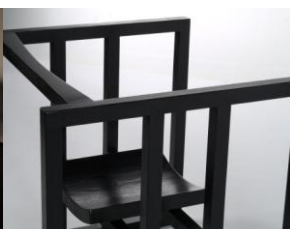
Fauteuil « 4 »