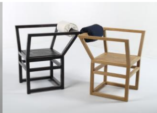
Chaises « 1,618 »