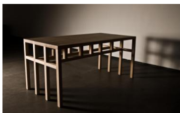
Table « 8 »

*Musée Réattu rue du grand Prieuré 13 Arles http://www.museereattu.arles.fr/