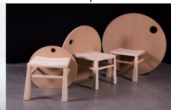
chaises « japan mornings »

Archedis : Editeur de mobilier contemporain, signé par des architectes, fabriqué en France par des maîtres artisans, édité en séries limitées.